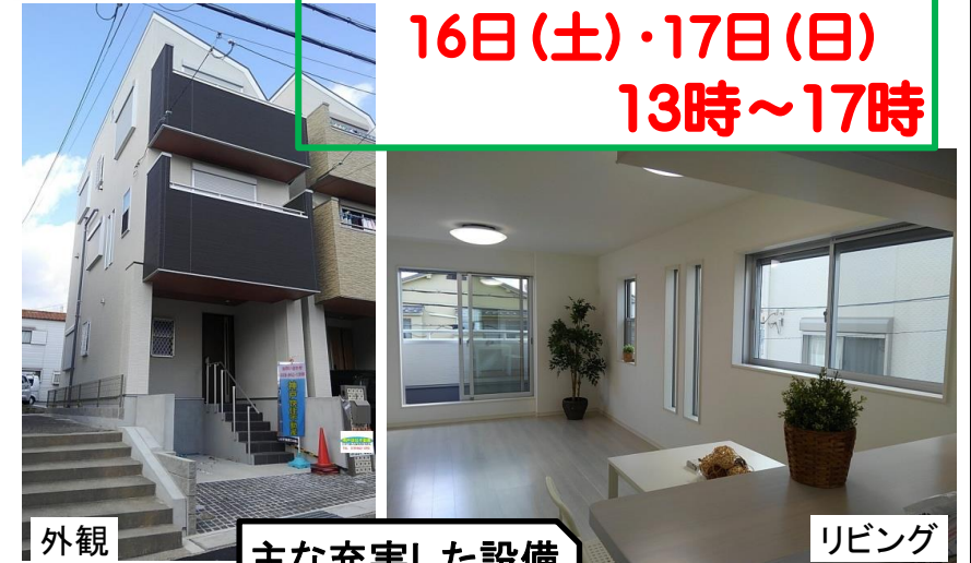
外観 主な充実した設備 リビング